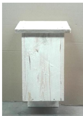
Nichoïrs réalisés par la commission environnement

Des nichoïrs de chauves-souris en bois fabrication maison vont faire leur apparition dans votre village. L'objectif est de faire venir ces chiroptères pour lutter contre les moustiques et notamment les moustiques tigres.