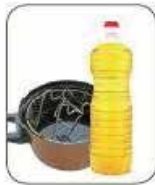
Huile de friture