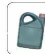
Huile de vidange