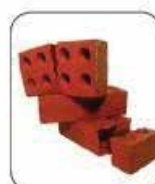
Gravats / Inertes